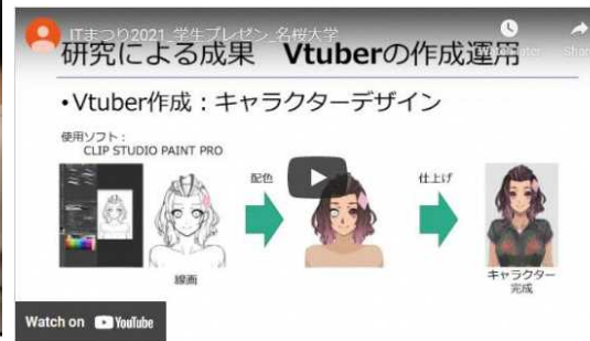
「名桜大学情報システムズ専攻」 (公立大学法人 名桜大学 情報システムズ専攻 研究活動報告)