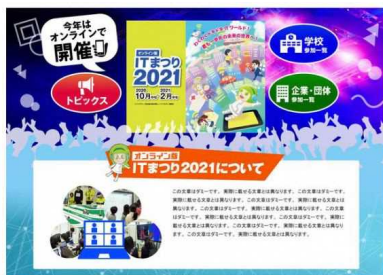
「オンライン版ITまつり2021」ウェブサイト

■「オンライン版ITまつり2021」ウェブサイトが公開されました。 「ITまつり」は、沖縄県内外のIT系の学校・企業・団体が参加して、研究活動や製品やサービスについて展示するイベントです。2008年の初開催以来、子供から大人まで家族連れで参加できるイベントとして知られるようになり、沖縄を代表するIT関連の展示会として定着しています。 例年1～2月ごろに会場で開催されてきたイベントですが、今回は新型コロナウイルスの感染拡大ともなってオンラインで開催することになり、名称も「オンライン版ITまつり2021」となりました。 「オンライン版ITまつり2021」のウェブサイトは令和2年10月26日(月)にオープンしました。オープン後も、新しい出展コンテンツが続々と増え続けています。 名称 : オンライン版ITまつり2021 開催期間 : 令和2年10月26日(月)～令和3年2月28日(日) 主催 : オンライン版ITまつり2021実行委員会 ウェブサイト URL : https://www.it-matsuri.net/