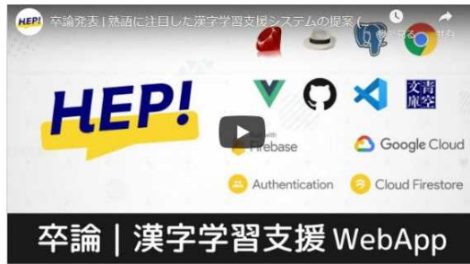
「熟語に注目した漢字学習支援システムの提案 情報系を学んだ大学生によるSPAを使った卒論」 (沖縄国際大学産業情報学部産業情報学科 仲宗根英人さん)