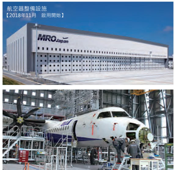
維修保養機體的情形 (航空器維修保養設施內的大型飛機檢修架 MRO Japan株式會社)