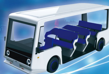
沖縄県産品10人乗りEVバス