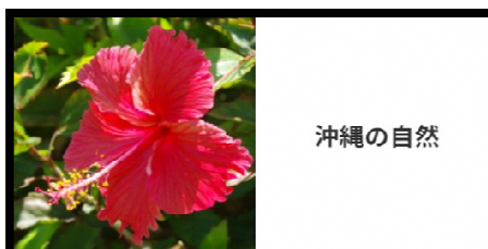
■商品名：沖縄チャンネル！