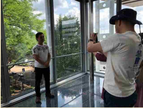
現地県人会向けの激励動画の撮影（シカゴ）