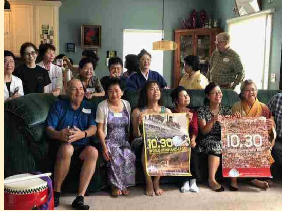
世界のウチナーンチュの日をPR（オハイオ）