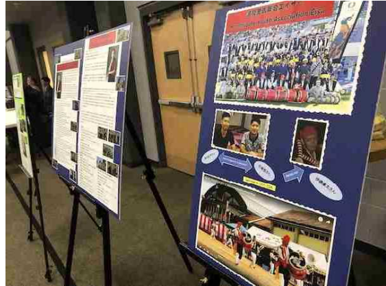
手作りの指導者紹介ボードも製作 (オハイオ)