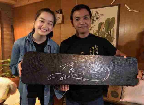
世界に雄飛する三線文化を 記念してサイン (シカゴ)