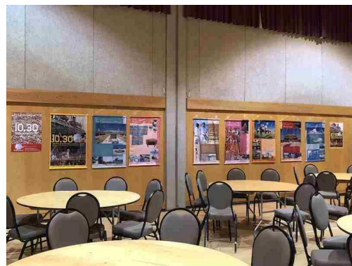
バナー掲示後、セッティングされた会場 (バンクーバー)