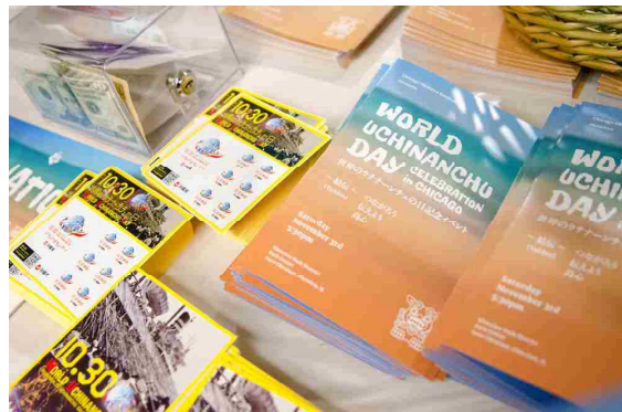
参加者に配布されたパンフレットと記念グッズ (シカゴ)