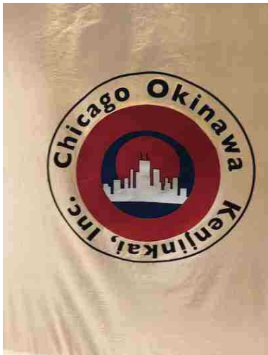
シカゴ沖縄県人会のフラッグがお出迎え (シカゴ)