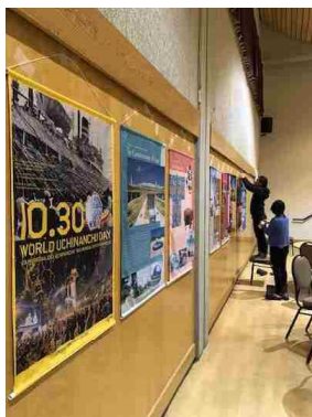
ウチナーンチュの日PRバナーを掲示 (バンクーバー)