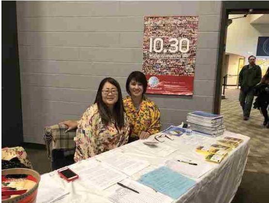
会場受付も笑顔でハイサイ！ハイタイ！ (オハイオ)