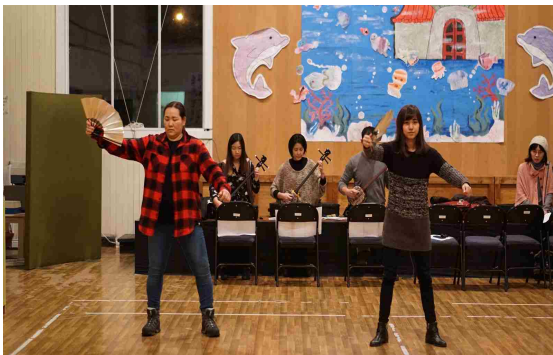
三線指導と琉球舞踊を立ち合いで助言する様子