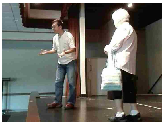
イベント本番となる会場のステージに立つ