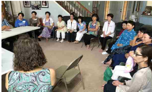
オハイオ州沖縄友の会とのミーティング