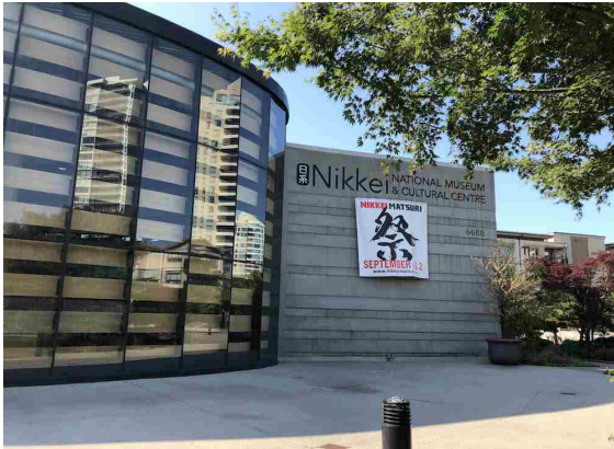
会場となるホール日系文化センターの外観

6688 Southoaks Crescent, Burnaby, BC V5E 4M7