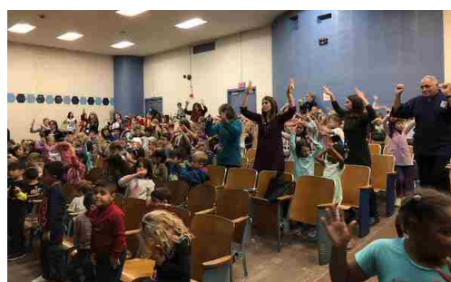
オハイオ州最大の小学校で沖縄文化を披露生徒も先生もみんな沖縄サウンド大好き