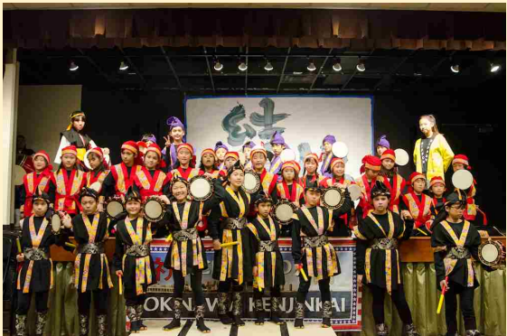
シカゴ公演で次世代メンバーと記念撮影