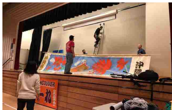
会場設営も皆んなで手作り