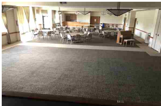
ホール室内の様子