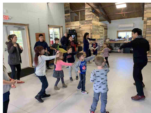
次世代ワークショップの様子 沖縄文化をユーモアたっぷりに伝えていきます