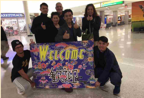
ツアーの始まり「オハイオ」での歓迎