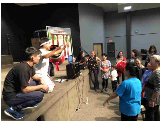
諸見里のエイサースピリッツが炸裂した リハーサル風景