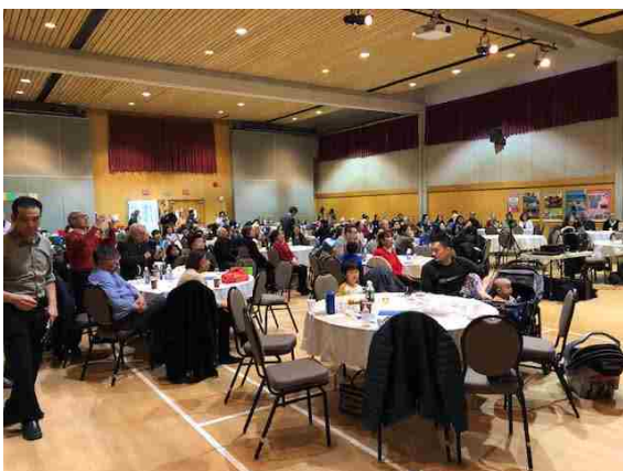
3つの部屋をぶち抜いて使用した 座席のレイアウト