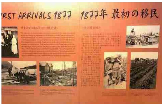
日系文化センター館内には 移民の歴史にまつわる貴重な展示も