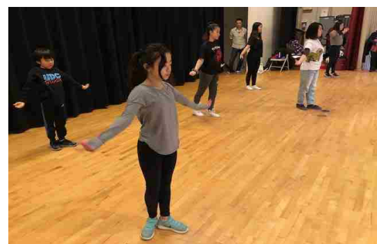
県系人キッズ初めての琉球ダンスに挑戦