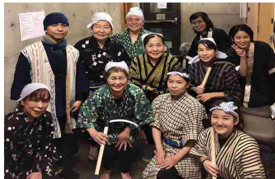
マミドーマ姿で準備万端