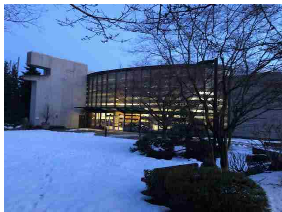
カナダの大自然の中に灯る日系文化の明かり 雪化粧が会場を飾る