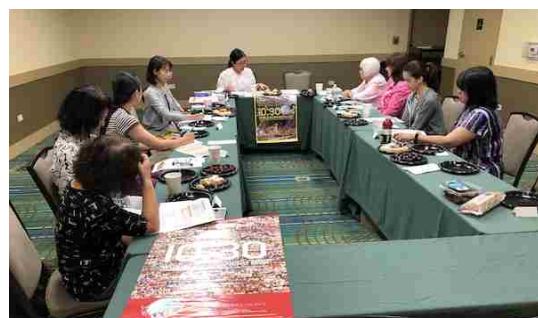
シカゴ沖縄県人会との意見交換会