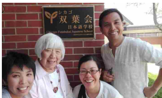
シカゴ双葉会日本語学校の視察