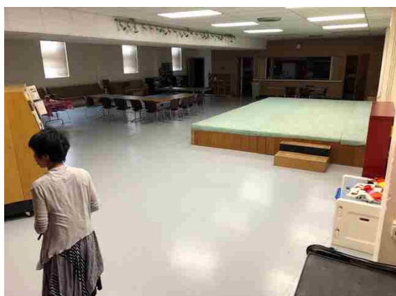
稽古やりハーサルで使用したマタイ教会ホール