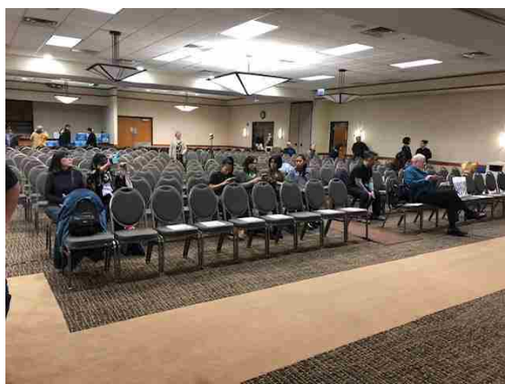
出演者も多いため席のレイアウトにも一工夫