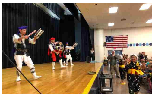
迫力あるエイサー太鼓の音が会場に響く！