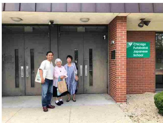
プレ公演会場のシカゴ双葉会日本語学校入口