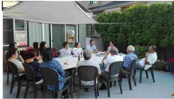
バンクーバー沖縄県友愛会との意見交換会