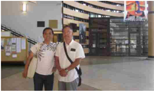
バンクーバー会場の下見