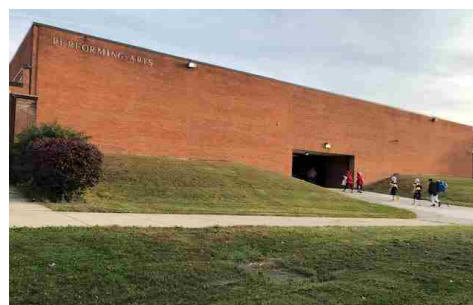
高校の会場となった素敵なホールの外観