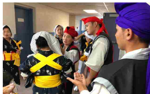
小学校では通路で着替えて支度しました