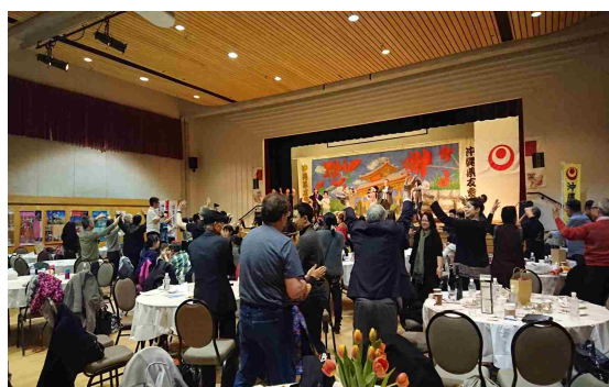
大賑わいのイベントの様子