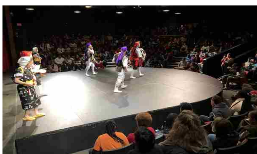
初めて見る沖縄文化に興味津々の高校生達