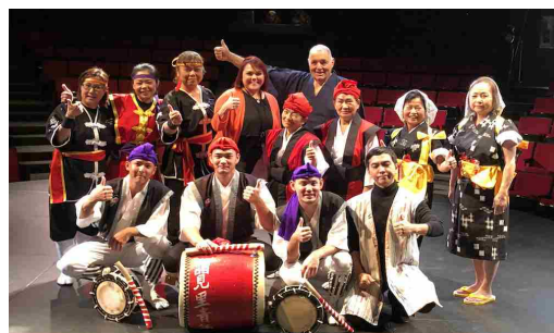
学校公演出演者とスタッフ