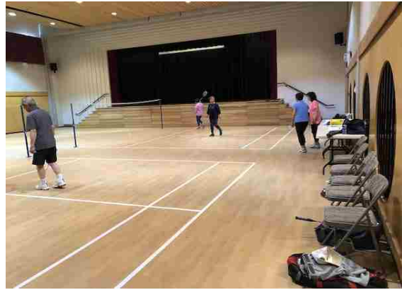
ホール室内の様子