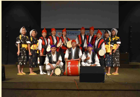
オハイオ公演での出演者記念撮影