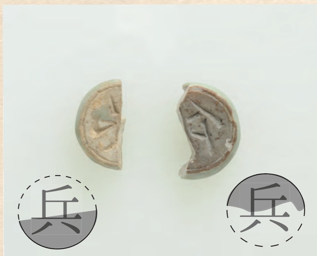
▲首里城跡から出土した象棋駒「兵」