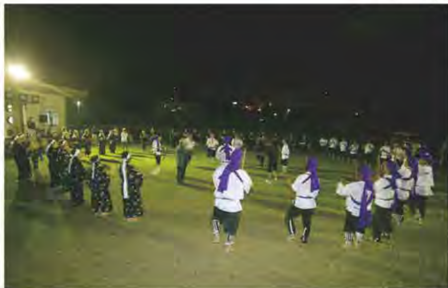
最後に巻踊とクイチャーを踊る