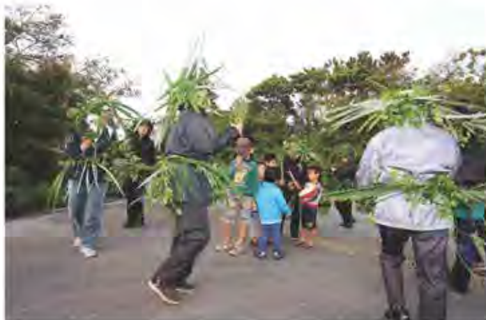
野原のサティパロウ