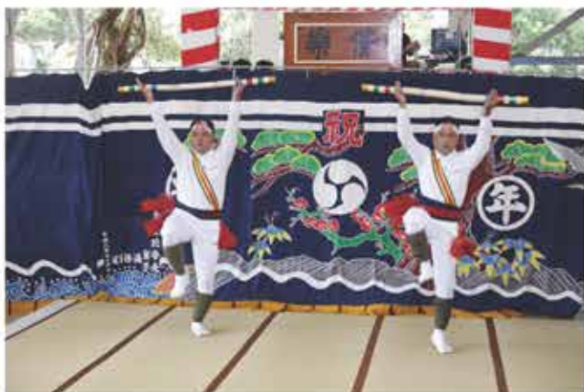
ポーアース (棒踊り)