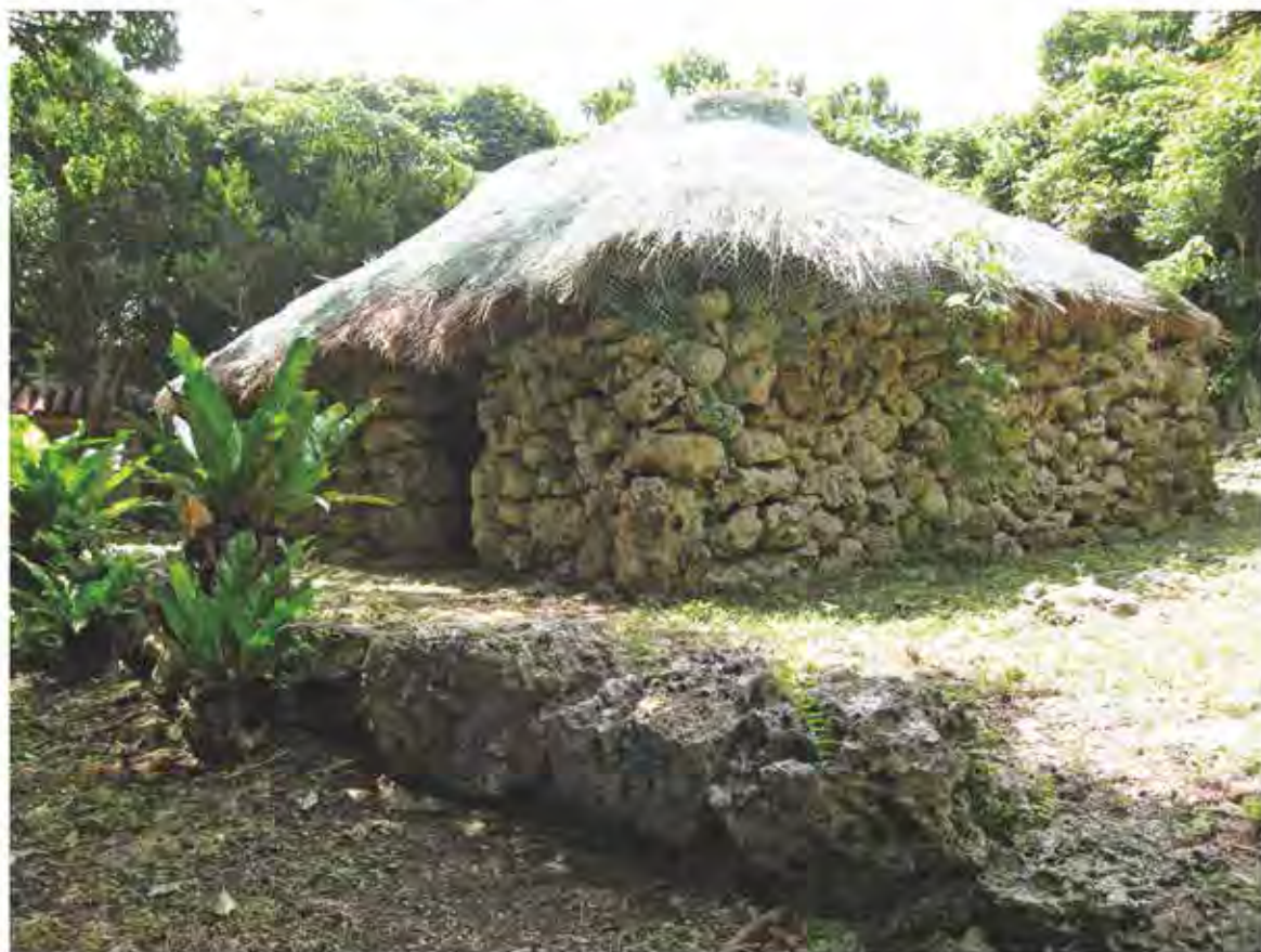
マイウイピャームトゥ*

です。それぞれほぼ南向きで、内部の面積は30㎡前後で、北側の壁に沿ってイビと呼ばれる香炉を置いた石組みがあります。祭神に関する由来については『雍正旧記』(1727年)や『宮古島旧記』に詳しく記されています。そこで行われる2月籠り、津波除けを目的とも伝えられるナーパイ、8月籠り(節祭り)などの主な行事には、ムトゥに属する人々が数日間籠り、籠り家の前庭における舟漕ぎ儀礼、ピャーシという神歌の飲酒儀礼やニーリの踊りがあります。