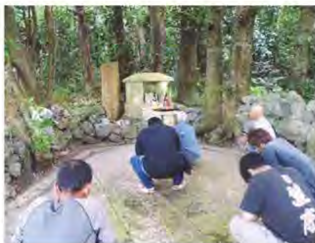
ンタバルウガンでの祈願*