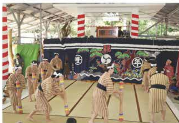
ンニツキ (キネツキ) 踊り