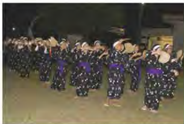
女性の踊り（前列クバ扇、後列四つ竹）