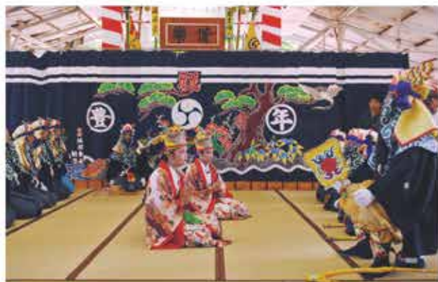
組踊「忠臣仲宗根豊見親」*