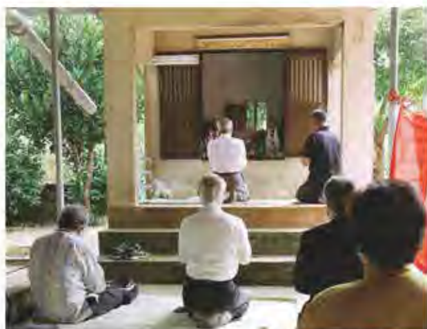
ピトゥマタウガンでの祈願*