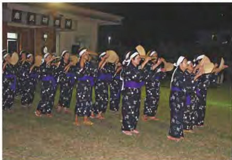
女性の踊り(クハ踊)