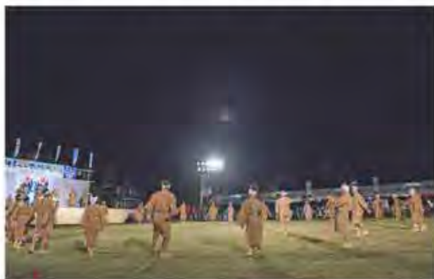
クイチャーは皆が輪になって歌い踊る