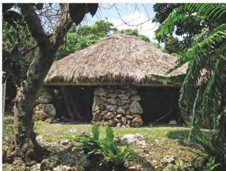
クスウイビヤームトゥ*