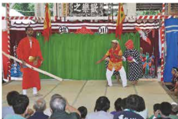
狂言「少女誘拐事件」*