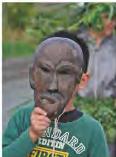
パーントゥの仮面(野原)

宮古島のパーントゥは、海のかなたからやってくる神が人々の災いを祓い、幸福をもたらすという沖縄の来訪神行事の特徴をよく表している重要な年中行事です。