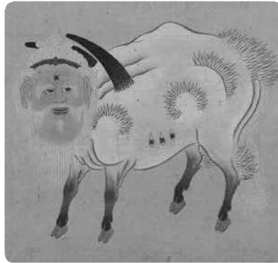
白子竿白沢之図(拡大)(118ページに掲載)