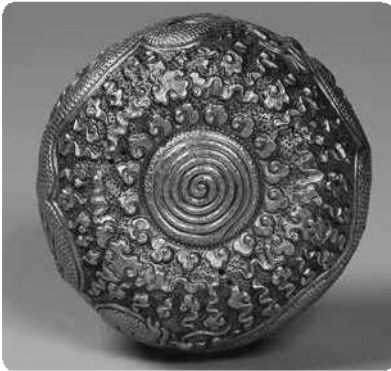
司馬大君御殿雲龍黄金罎(上面)(178ページに掲載)