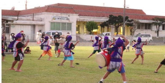
豊年祭エイサー演舞

自治会公民館を開催拠点として、伝統芸能の学習・体験活動や地域行事への参加を行っている。子ども達や、保護者の居場所づくり、また地域住民と関わることで、地域全体で子どものサポートできるつながりを築いていく。