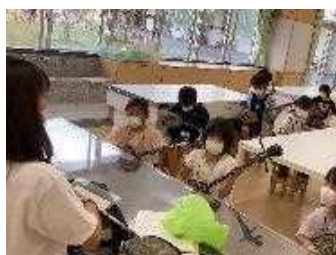
三線教室(志真志小)