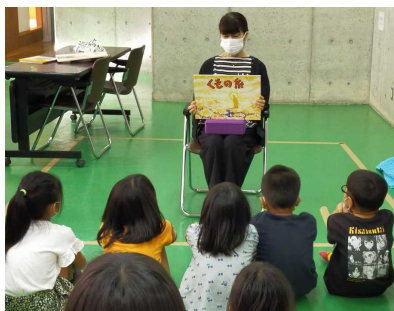
地域の方による紙芝居