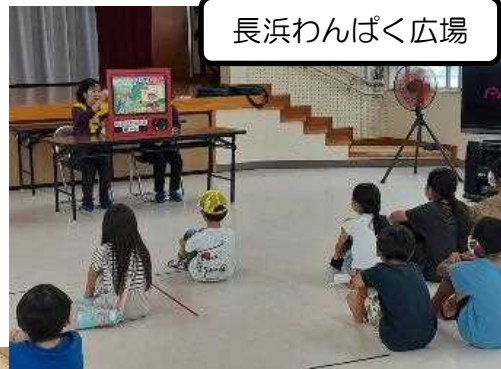
長浜わんぱく広場