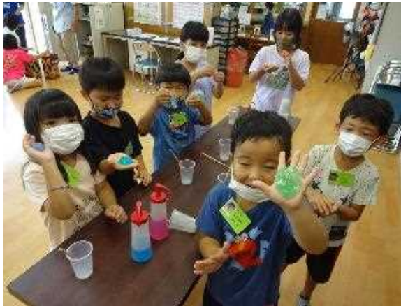
長嶺小学校 スライムづく

科学工作教室、うちなーぐち教室、川柳教室、三線、英語遊び、季節や行事に合わせた工作 など