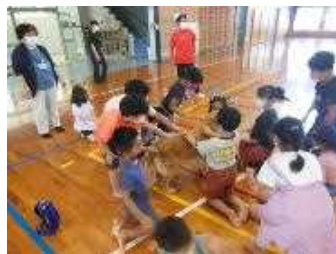
アニマルセラピー(普天間小)