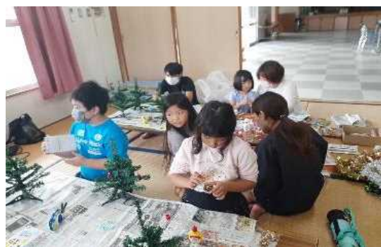
子ども会クリスマスツリー作成