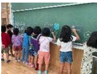
自由活動(志真志小)