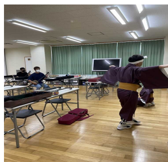
学習発表会の練習