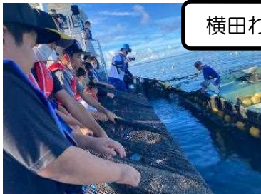
横田わんぱく広場