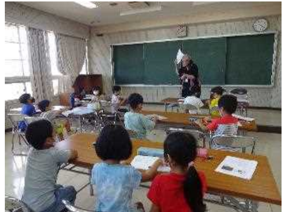
伊良波小学校 川柳教室