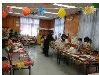
お買い物体験(普天間小)