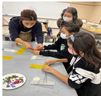
みつろうキャンドル作り