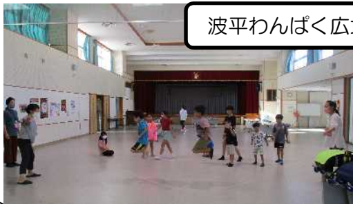
波平わんぱく広場