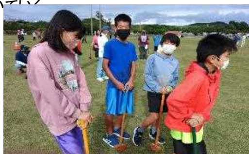
区民の日グランドゴルフ大会