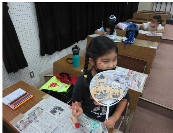
工作（うちわづくり）