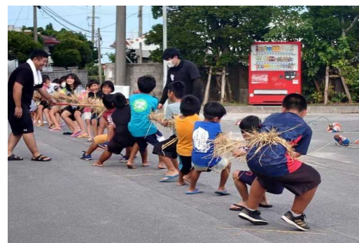
豊年祭綱引き体験