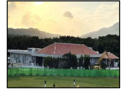
(東部地区複合施設)