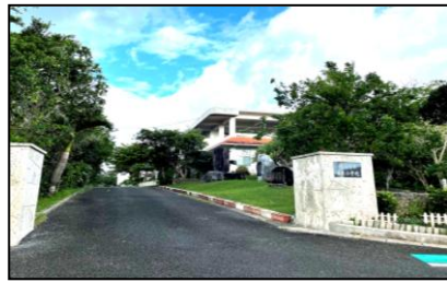
校訓「心豊かに たくましく」