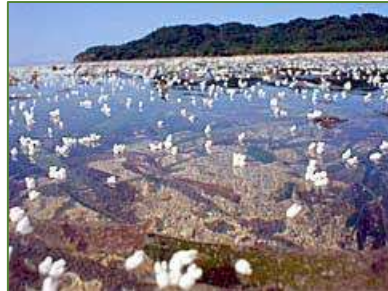
学校近くの海岸に流れ着くウミシヨウブの花