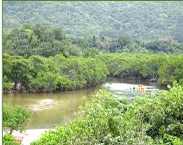
学校近くの吹通川の mangrove 林