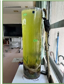
ウミシヨウブを教室で栽培