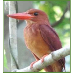
リュウキュウ アカショウビン