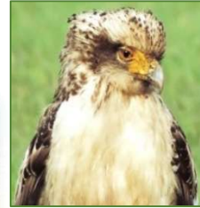
カンムリワシ 国指定特別天然記念物 (市の鳥)