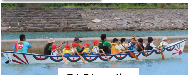
フナクヤハーリー