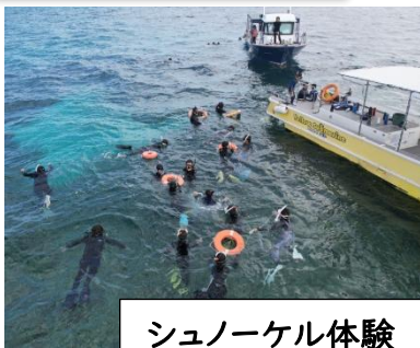
シュノーケル体験