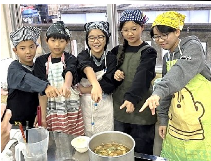
R8.1 さぶっこ食堂オープン