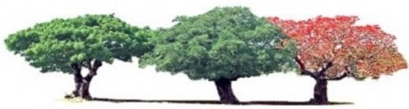
三本木(アコウ・ガジュマル・デイゴ)