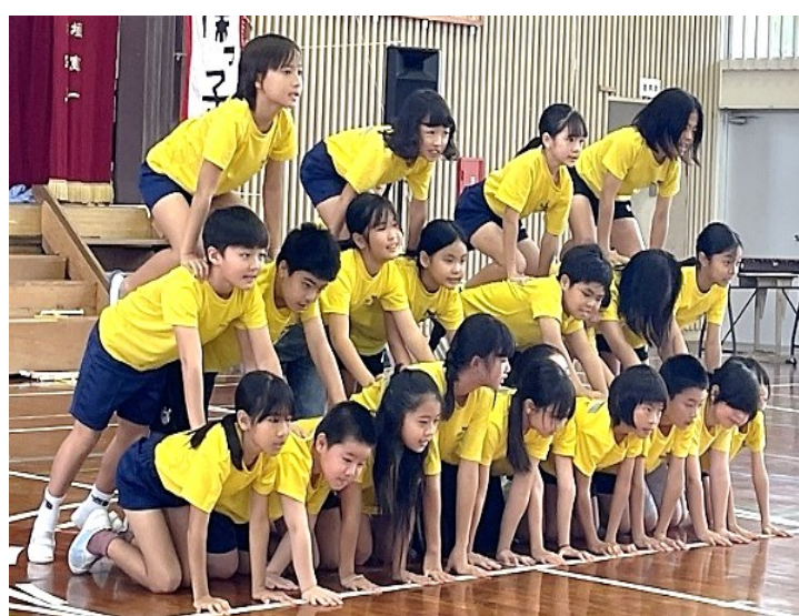
R8.2 しらほっ子発表会