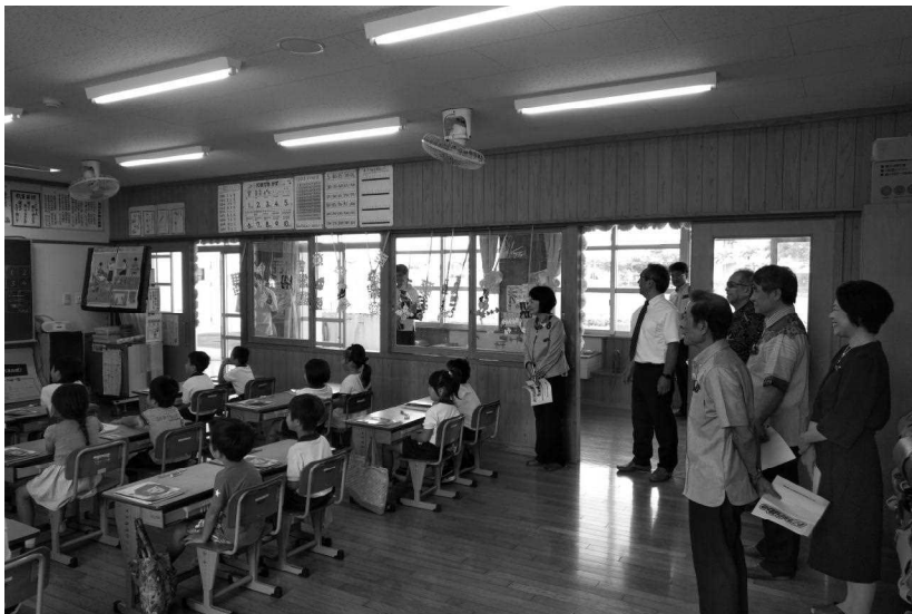
宮古島市立西辺小学校 (平成30年5月9日)