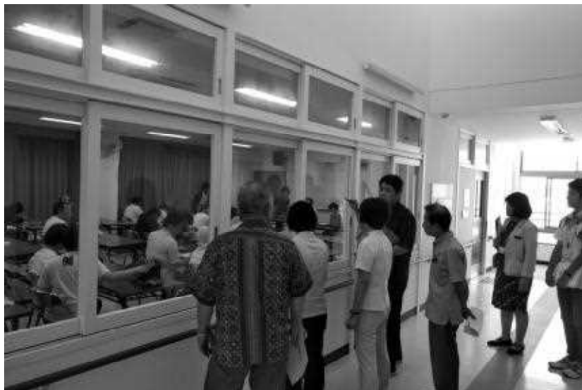
県立沖縄盲学校 (平成30年7月11日)