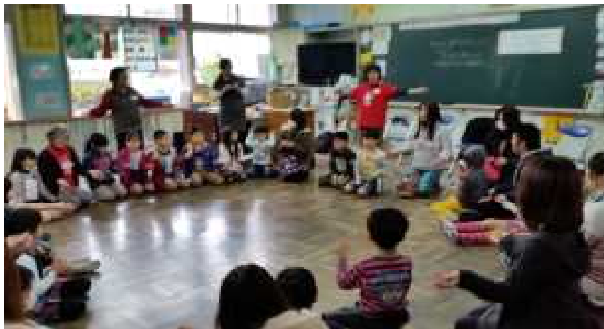
宜野湾市学校支援地域本部（宜野湾市）