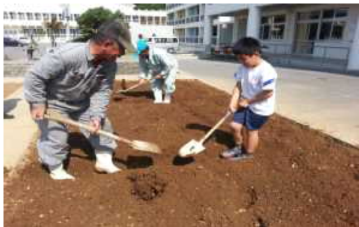
南城市学校支援地域本部 （南城市）