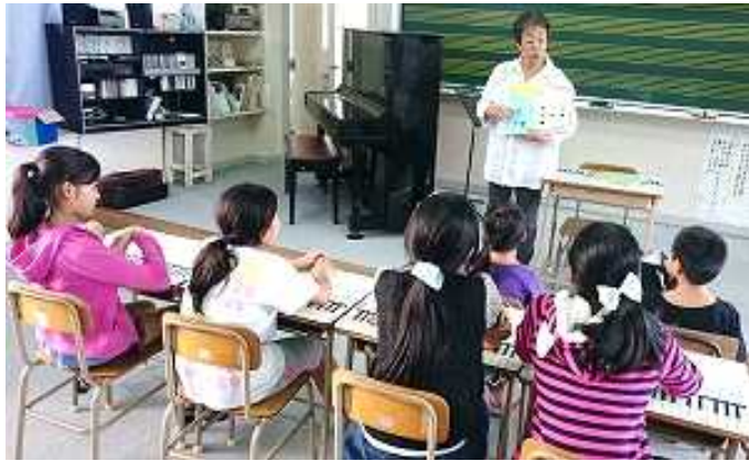
富野美ら心教室（石垣市）