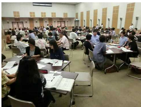
コーディネーター研修会（6月）