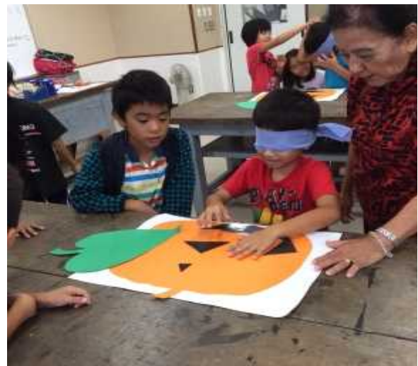
本部小学校放課後子ども教室（本部町）