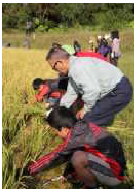
伊波中学校区学校支援地域本部 （うるま市）