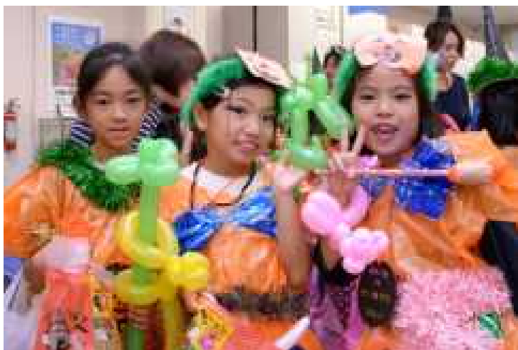
きら☆きらり子ども教室 （与那原町）