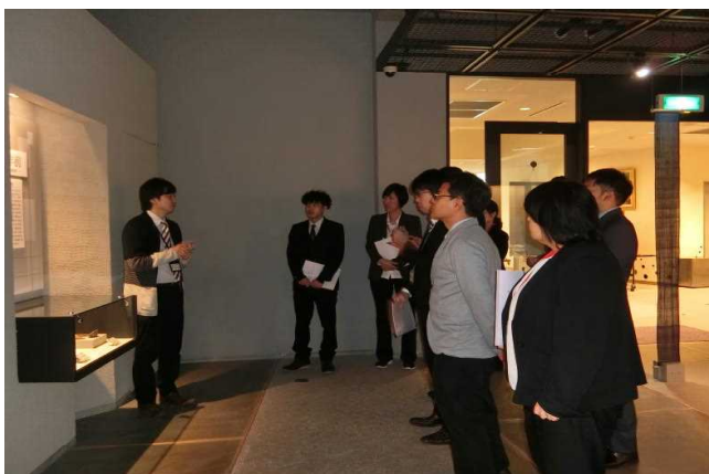
現地研修（那覇市立壺屋焼物博物館）