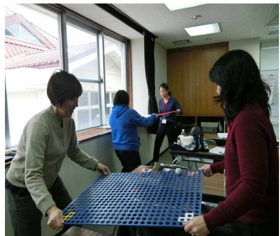
宿泊研修（糸満青少年の家）