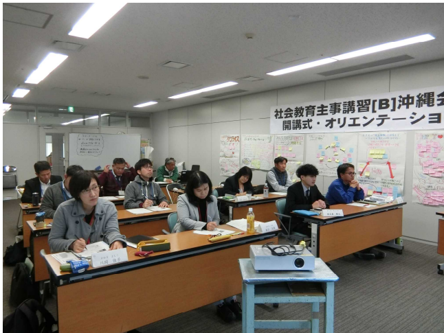
開講式・オリエンテーション