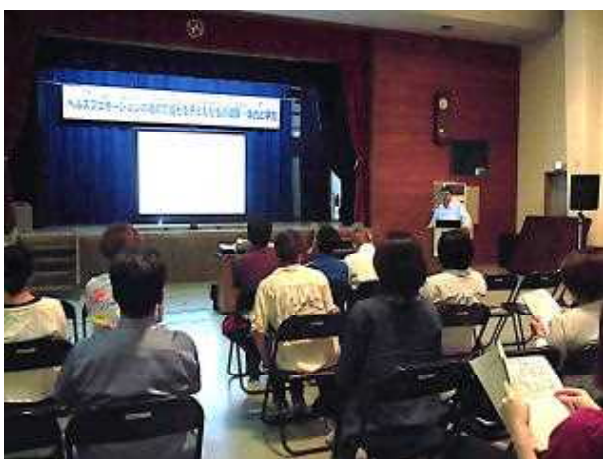
第6回講座 離島講座in竹富町（西表島）