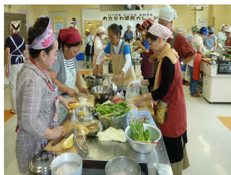
◇八重山教育事務所