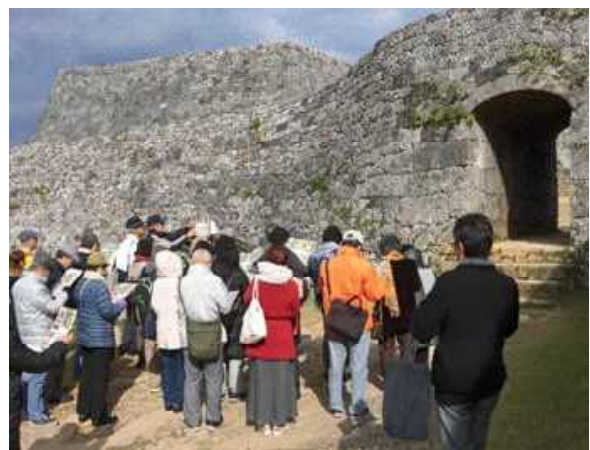
第10回講座【琉球の城を歩く～in座喜味城～】