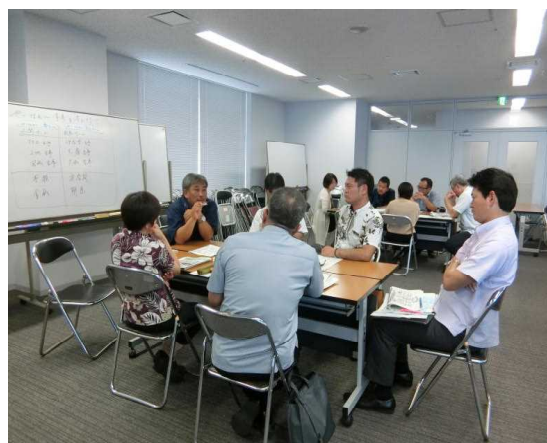
沖縄県社会教育主事専門講座 2 (グループ討議)