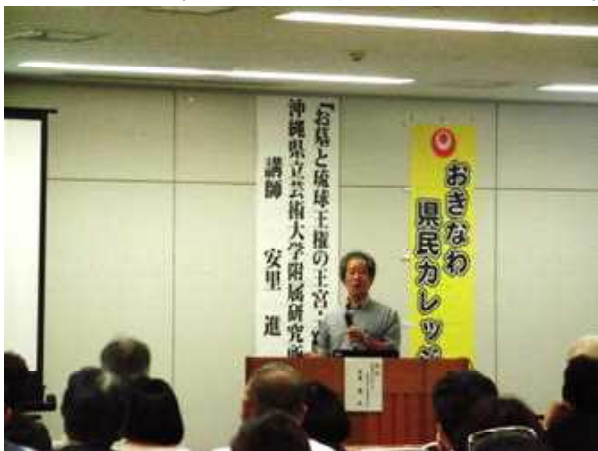
第2回講座【お墓と琉球王権の王宮・王陵は意外な関係】