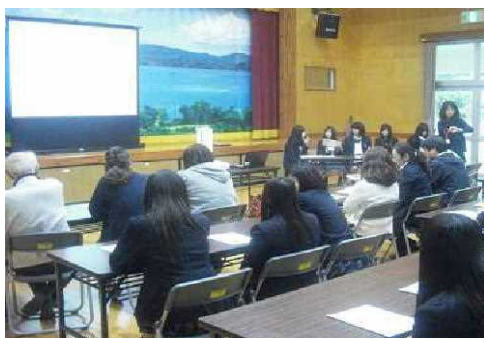
◇名護商工高等学校