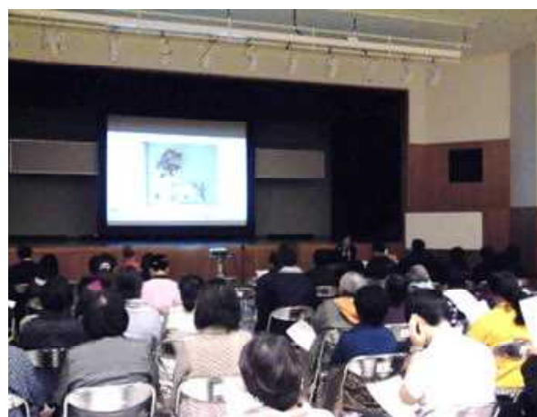
第8回講座 離島講座in伊是名村