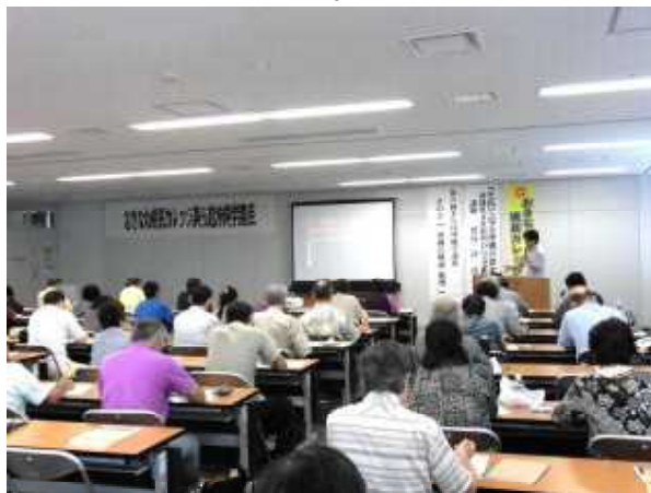
第5回講座【史料でみる沖縄の歴史 その2 沖縄の戦前・戦後】