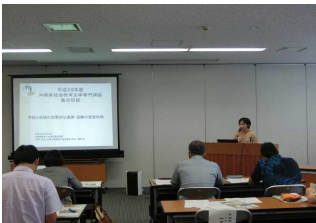
沖縄県社会教育主事専門講座 1 (行政説明)