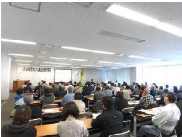
第9回講座 【沖縄の名前のはなし】