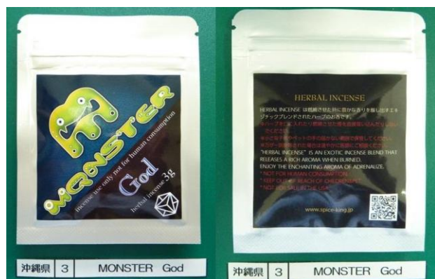
図2. 指定薬物が検出された製品パッケージ