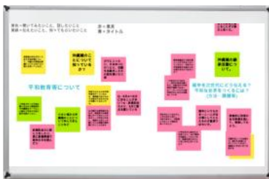
📷 各グループからの発表資料