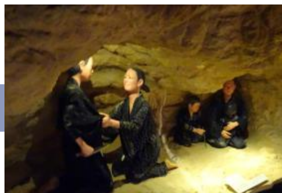
ミュージアム沖縄戦部分の展示より。チビチリガマ内部、状況を再現したジオラマ。