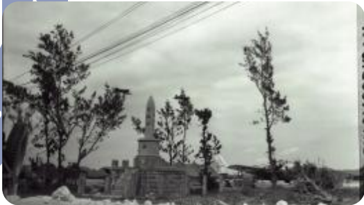
1945年4月上陸後米軍が撮影した忠魂碑