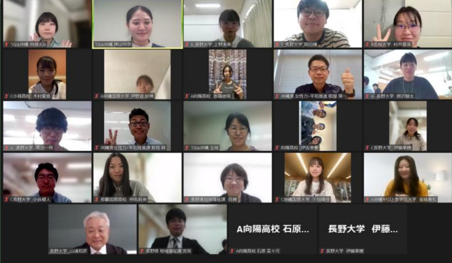
📷 長野・沖縄県の集合写真