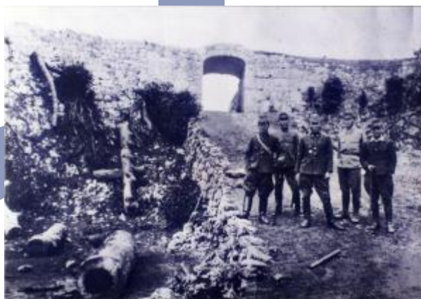
座喜味城跡に駐屯した日本兵