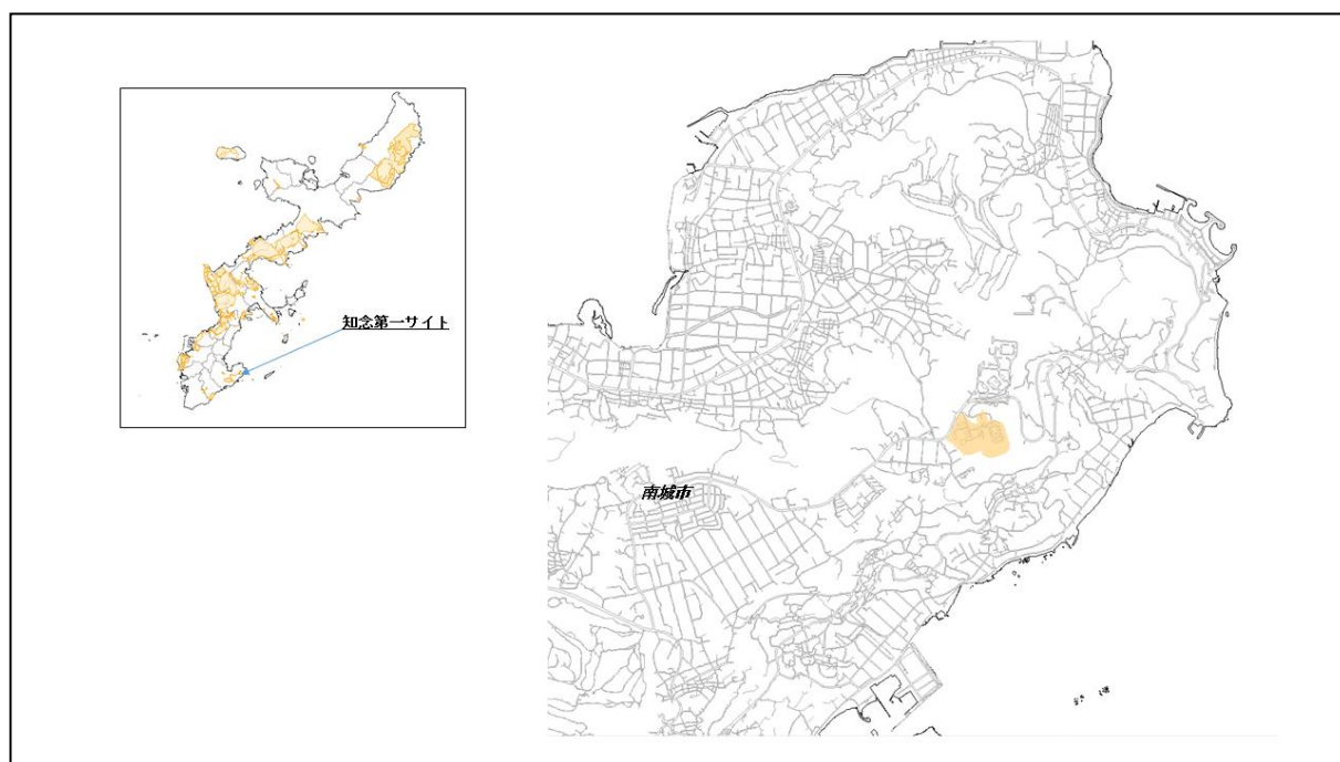
図 66-1 知念第一サイトの位置図（昭和 47 年時）

( http://www.mofa.go.jp/mofaj/area/usa/sfa/kyoutei/pdfs/02_03.pdf ) を参照