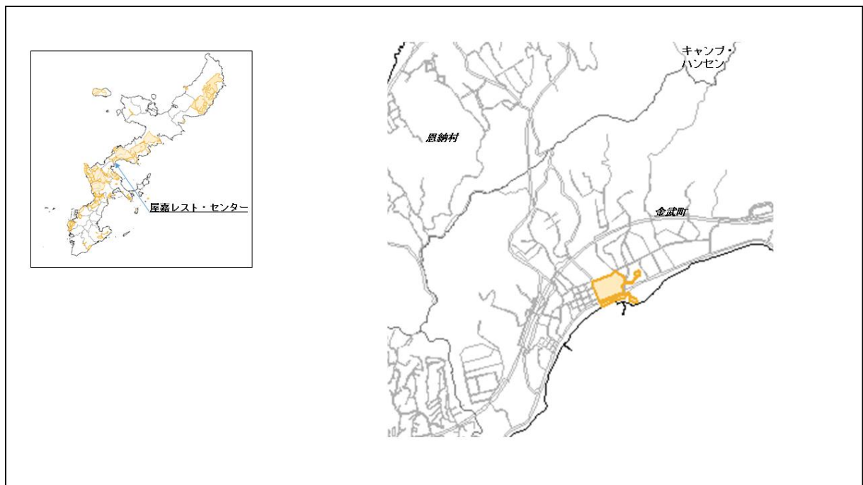
図 16-1 屋嘉レスト・センターの位置図（昭和 47 年時）

( http://www.mofa.go.jp/mofaj/area/usa/sfa/kyoutei/pdfs/02_03.pdf ) を参照