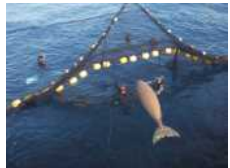
定置網でのレスキュー訓練

沖縄県や環境省では、ジュゴンを保護する目的で、レスキュー訓練や周知イベントなどを各地域で開催しています。ジュゴンと海草藻場を守るための取り組みには、県民の皆様の関心と理解が不可欠です。