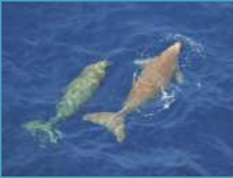
ジュゴンの親子 成獣の体長は3m程度

ジュゴンは、西太平洋やインド洋、紅海の暖かい海に生息する動物で、沖縄は世界の分布の北限にあたります。世界中でジュゴンの個体数は少なくなり、そのため各国の法律などで保護されています。沖縄県内には、これまで沖縄島周辺の限られた海に生息すると考えられていましたが、近年先島諸島にも生息することがわかってきました。