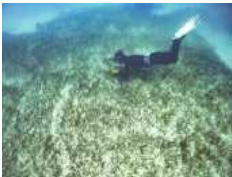
ウミンチュによる食み跡の調査

ジュゴンは、海草藻場で海草を食べることで、藻場を耕し、多くの生き物が生存できる環境をつくるはたらきが知られています。ジュゴンが訪れる海は、生物多様性の高い、豊かな海草藻場がある証です。