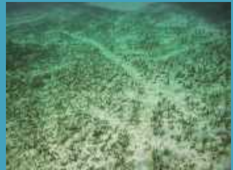
ジュゴンが海草を食べた形跡（食み跡）

ジュゴン(ザン、ザンヌイユ)は、海草藻場で海草(ザングサ、ジャングサ)のみを食べています。海草藻場は、「海のゆりかご」とも呼ばれ、多くの生き物の生息環境、アカジンやマクブなどの幼魚のすみか、水質や底質の安定化、餌資源、二酸化炭素の吸収など大切な役割があるだけでなく、水産業の場としても「サンゴ礁」や「干潟」と共に大切な海の環境です。