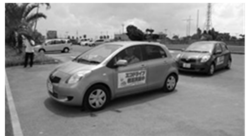
エコドライブ教習会

平成17年2月16日の京都議定書発効日に、地域における温暖化防止活動の核として、温暖化の現状やその対策に関する正しい知識の普及や、身近な省エネ対策のアドバイスなどを行う「沖縄県地球温暖化防止活動推進員（任期：3年）」を35人委嘱しました。令和2年度末現在は73名の推進員が普及啓発活動を行っています。