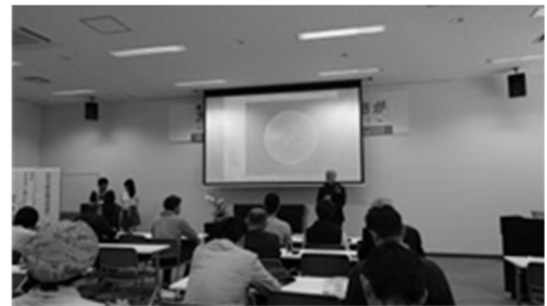
沖縄県地球温暖化防止活動推進員研修

地球温暖化防止活動推進センターは、地球温暖化対策推進法第38条に基づき、各都道府県に1か所、知事により指定される機関で、本県では、平成15年11月に（一財）沖縄県公衆衛生協会を「沖縄県地球温暖化防止活動推進センター」として指定しました。