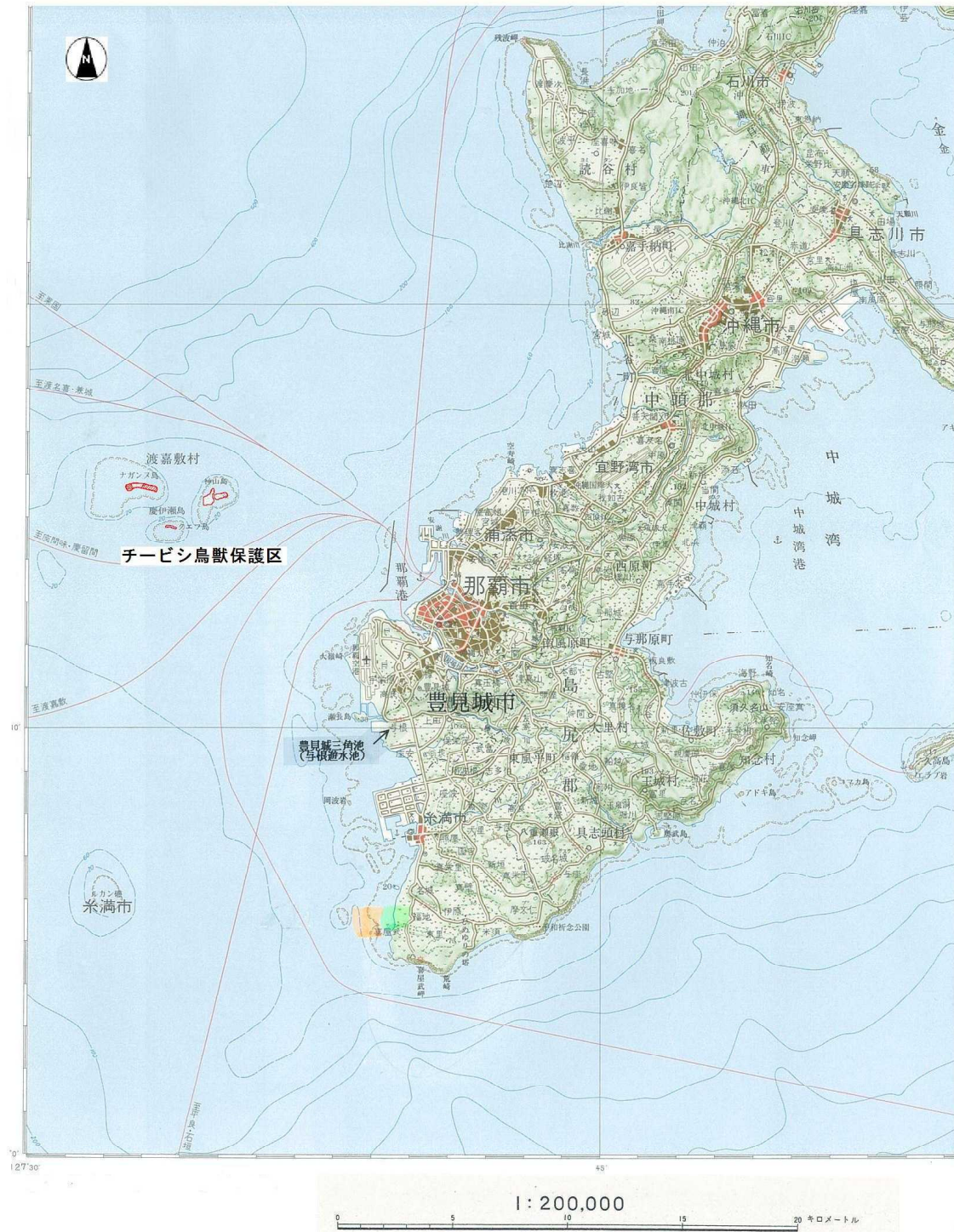
沖縄県指定チービシ鳥獣保護区位置図