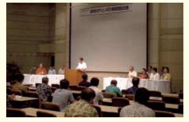
Conserving the global environment through partnerships and cooperation (Okinawa Agenda 21 Prefectural Assembly)