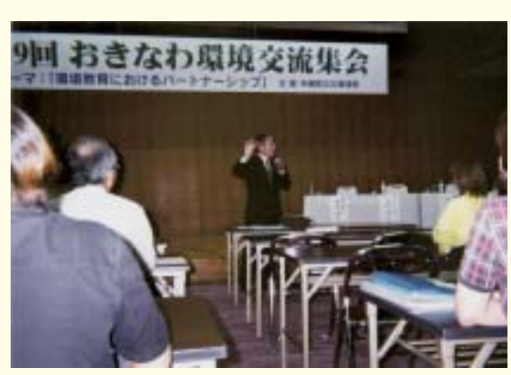
Networking for environmental conservation (An Okinawa Environment Information Meeting)

Each sector needs to proactively implement the guidelines for environmental consideration set out under this Plan.