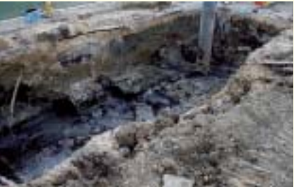
Drums filled with tar-like matter found buried in a empty lot of Mihama, Chatan Town