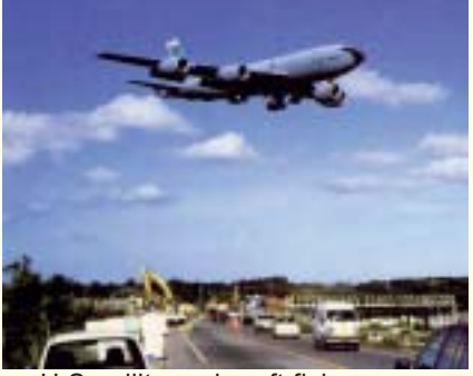
U.S. military aircraft flying over Prefectural highway (Kadena Town)

cern in northern Okinawa Island, a treasure house of internationally important animal and plant species such as the indigenous Pryer's Woodpecker. There is concern over the impact on marine ecosystems caused by the heliport construction plan in the Henoko district (candidate site for relocation of Futenma Air Station) on the eastern coast of