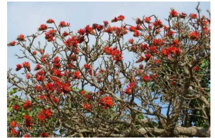
デイゴの開花状況