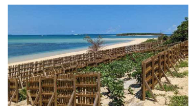
治山事業（海岸防災林）