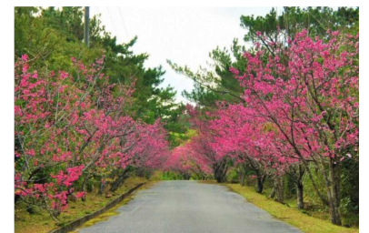
R3認定 / アーラ林道（久米島町） 8