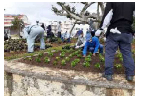
心豊かなふるさとづくり推進協議会（北谷町）