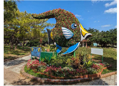
立体造成花壇植栽業務（那覇市）