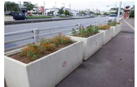
フラワークリエイション事業