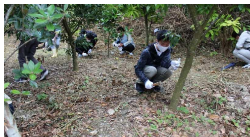
かいぎん平和の森育樹祭（沖縄海邦銀行）