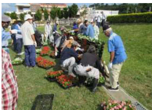
心豊かなふるさとづくり協議会（北谷町）