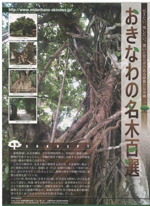
おきなわの名木百選（環境再生課）