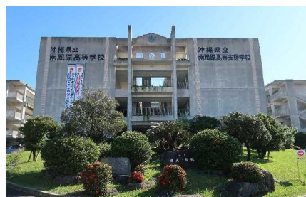
緑化コンクール R4準特選 （県立南風原高等学校/高等支援学校）