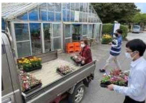
花のゆりかご事業（県環境再生課）