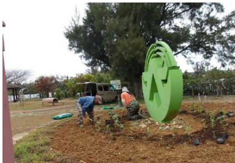
花いっぱいクリーン環境整備事業（南大東村）