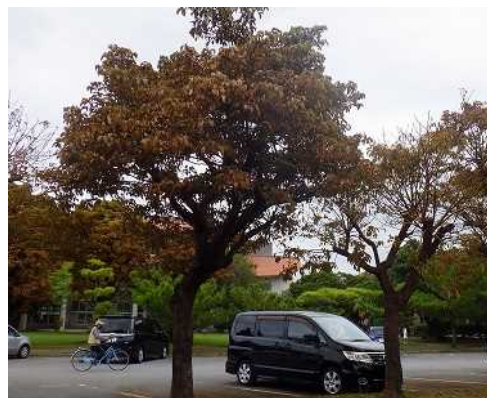
アカギヒメコバイによる被害（アカギ）