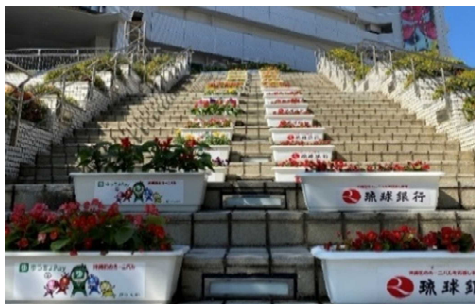
沖縄観光受入対策事業（県観光振興課）