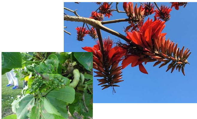
デイゴの花とデイゴヒメコバチ被害