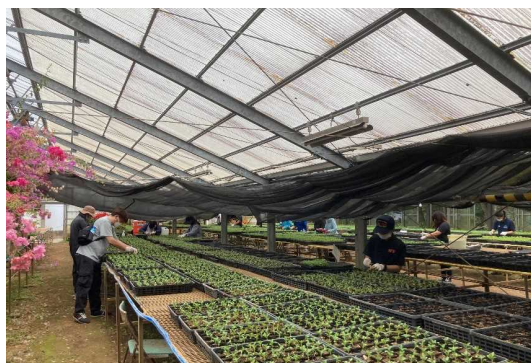
名護さくらのまち推進事業（名護市）