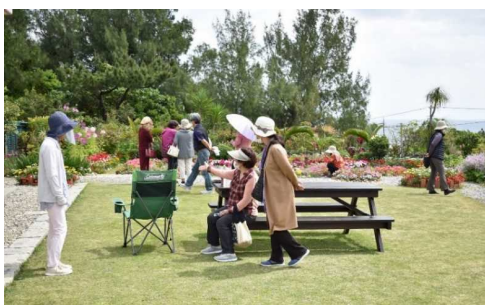
オープンガーデン（宜野座村）