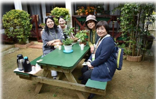
オープンガーデン (宜野座村)