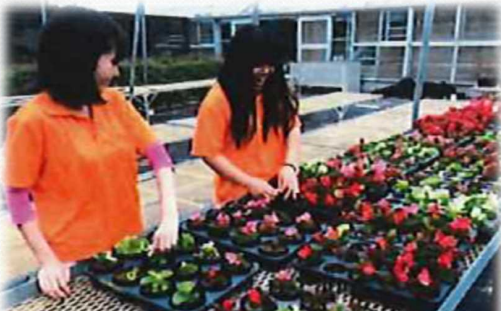
花のゆりかご事業 (県環境部)