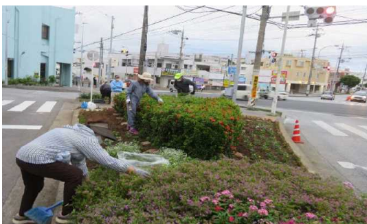
③ 宜野湾市 花いっぱい運動事業