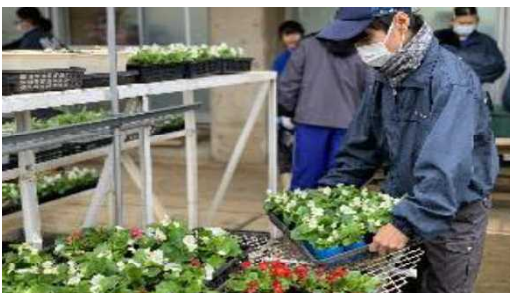
特別支援学校緑化事業