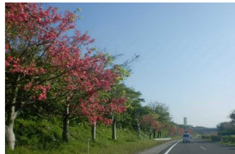
沖縄自動車道 (トックリキワタ)