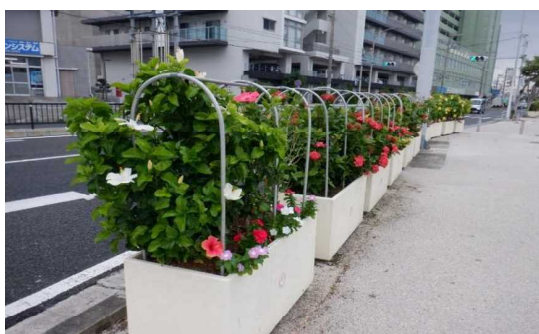
県道7号線 (奥武山米須線)