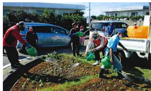
④ 宮古島市 花いっぱい推進事業