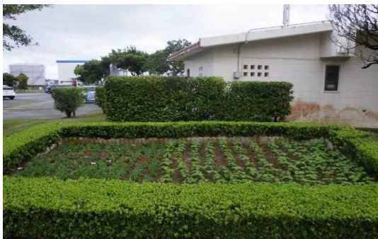
石川火力発電所構内