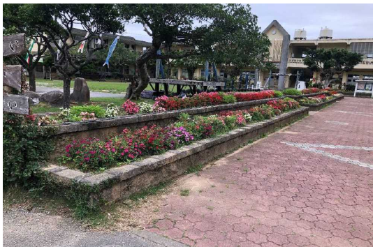
① 国頭村 緑の少年団活動奨励事業