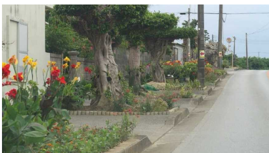
県道250号線 (真栄平はなの会)