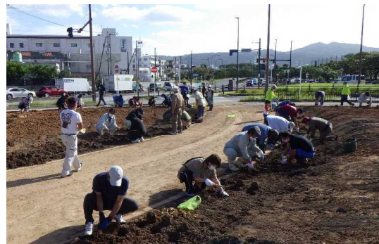
② 名護市 花の里づくり事業