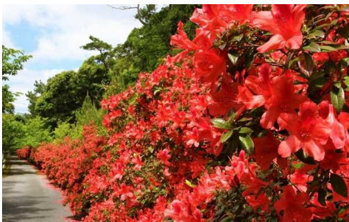
R3 だるま山公園と遊歩道（久米島町）