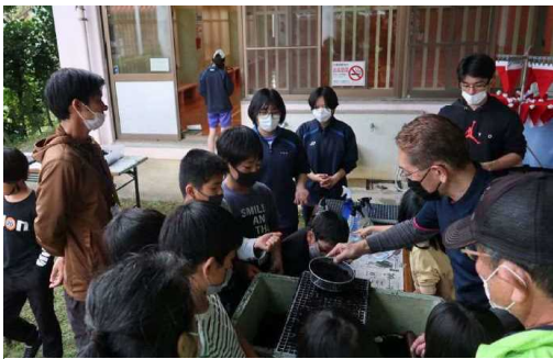
児童館での講習会