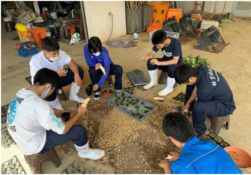
生徒による花苗の生産