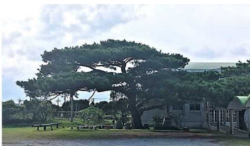
R2 旧大宜味小学校跡地のシマンター平松