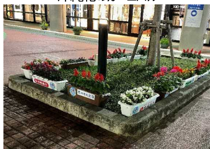
アウトレットモールあしびなー