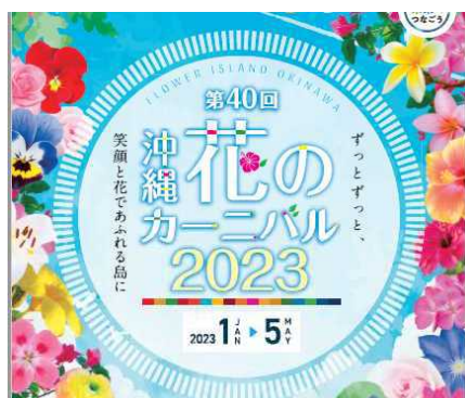
沖縄花のカーニバル