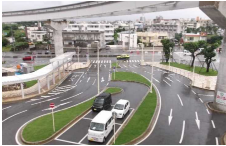
城間前田線 (モルレル交通広場)