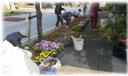
県道137号線（南城市津覇古）

▷事業内容：ボランティアで道路植栽等の管理活動を行う住民団体を募集し、道路の景観向上を図る。地域住民の緑化活動も支援