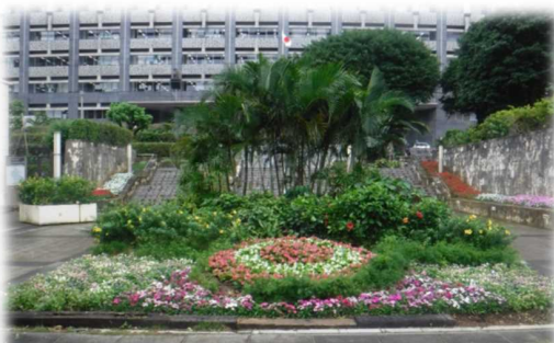
県道39号線（県民広場）

▷事業内容：観光地への主要アクセス道路等に花木（プランター）の設置や植樹柵へ植栽を行う。