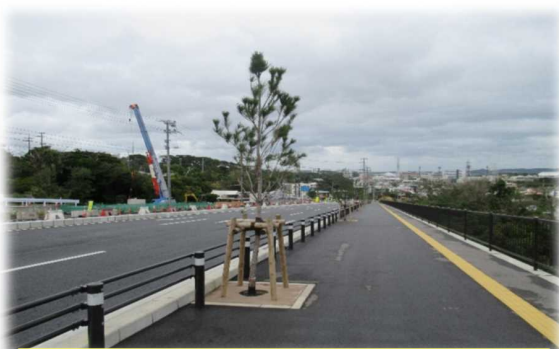
宜野湾北中城線（道路歩道植栽）