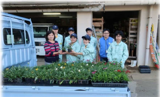
近隣小中学校・地域へ配布