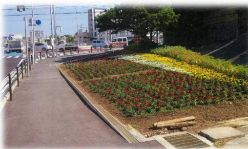
県道42線（真地交差点）