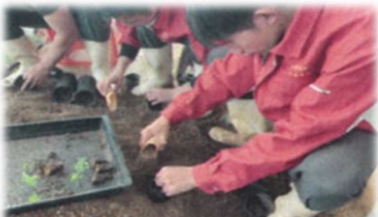
生徒による花苗の生産