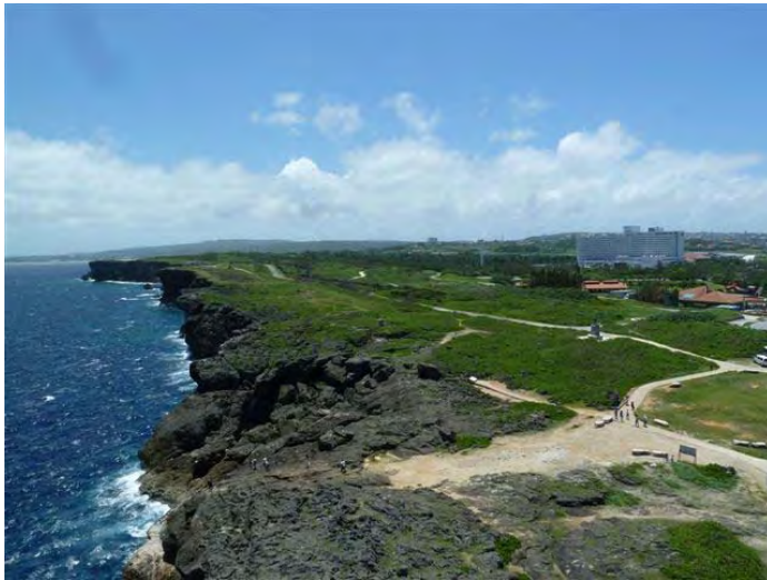
多くの観光客が訪れる景勝地の残波岬（読谷村）