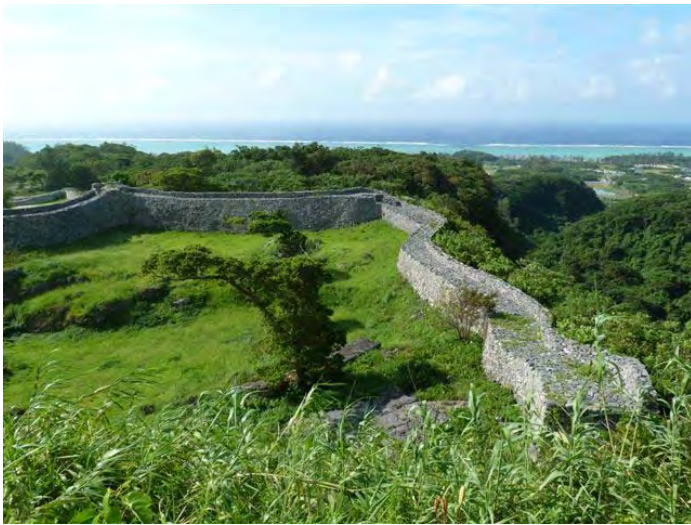
亜熱帯広葉樹林に囲まれた世界遺産 今帰仁城跡（今帰仁村）