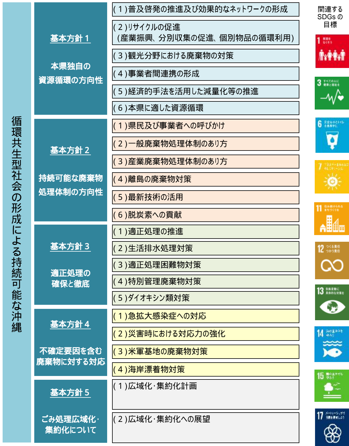
図 1.2 第六期計画の施策体系