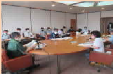
◎令和4年度沖縄県食品の安全安心推進本部会議開催（衛生薬務課）

令和4年度は、食品の安全安心に係る全庁的な危機管理対応が必要となる緊急事態は発生していないため、緊急時の召集は行っていないが、令和3年度の関係部局の施策の実施状況の把握ため、「沖縄県食品の安全安心推進本部会議」を開催しました。【衛生薬務課】