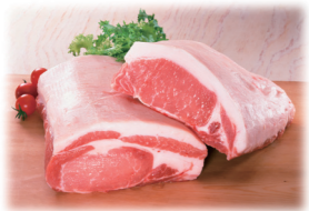
豚ロース / 国産