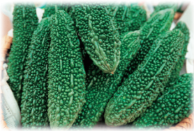
ゴーヤー / 沖縄県産