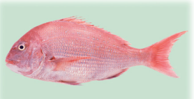
マダイ(養殖) 鹿児島県産