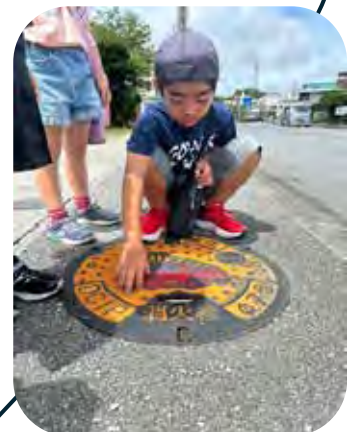
写真は わくわく東風平学童クラブ、 にっこ学童(大西クラブ)のみなさんです