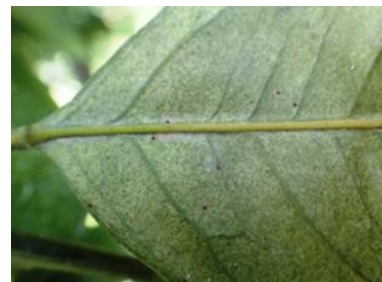
ハダニの寄生による葉のかすれ症状