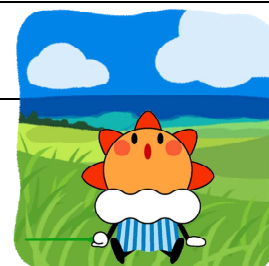
気象庁マスコットキャラクター はれるん