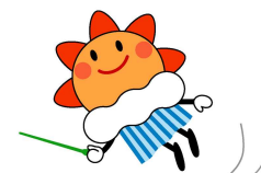
気象庁マスコットキャラクター はれるん