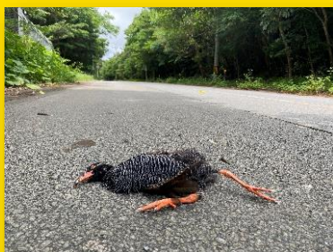
ヤンバルクイナ 国指定天然記念物 国内希少野生動植物種 環境省RL 絶滅危惧 I A類(CR)