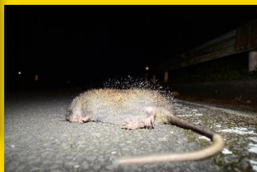
ケナガネズミ 国指定天然記念物 国内希少野生動植物種 環境省RL 絶滅危惧 I B類(EN)