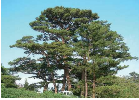
県木 リュウキュウマツ

マメ科の落葉大喬木で原産はインドです。小枝の先端から花枝に総状花序をなし、深紅色で燃えたつように美しい花が3月から5月頃に咲きます。また幹材は、琉球漆器の材料として用いられています。