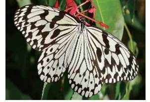
県蝶 オオゴマダラ

(方言名 = グルクン) 色彩豊かな25cm前後の美しい魚で、熱帯性で沖縄からインド洋にかけて分布しています。沖縄では数少ない大衆魚として広く県民の食卓で親しまれています。