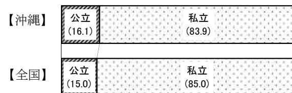
図6 設置者別園数の構成比 (%)