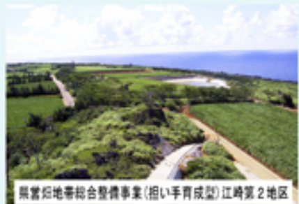
県営地域帯総合整備事業(担い手育成型)江崎第2地区