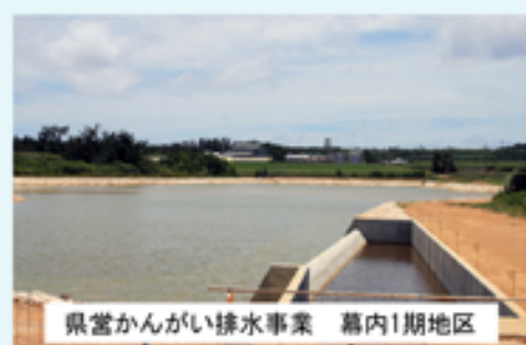
県営かんがい排水事業 幕内1期地区