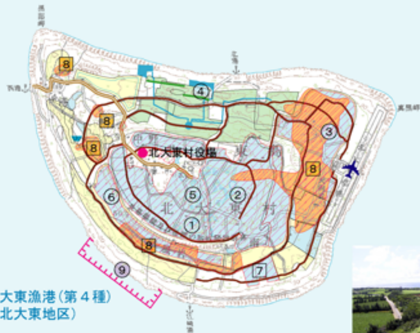
南大東漁港(第4種) (北大東地区)