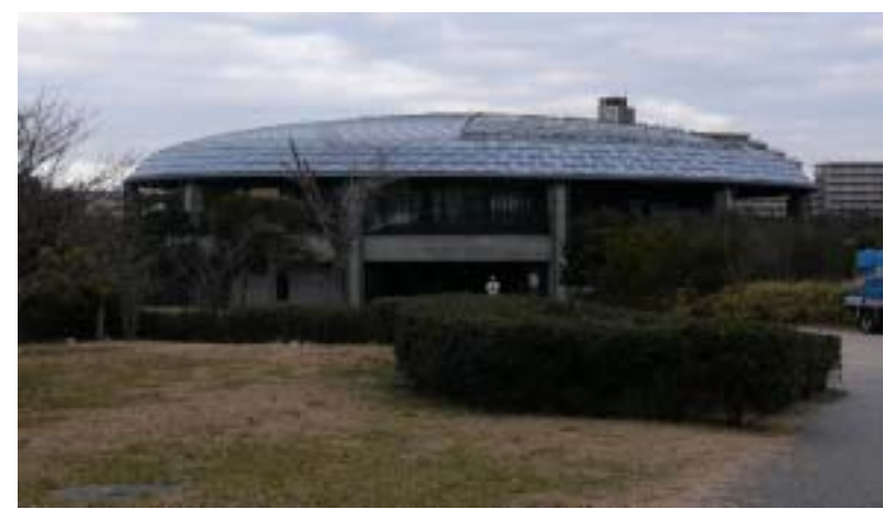
■ウォッチングセンター