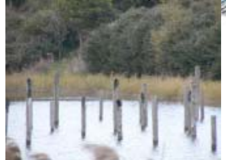
■杭上のカウ(休息場)