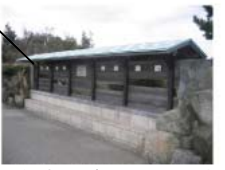
■観察版(窓の位置を工夫)