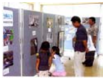
■ 企画展示コーナー