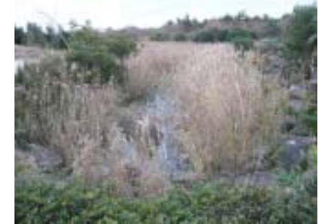
■漣筋でアオサギが採餌