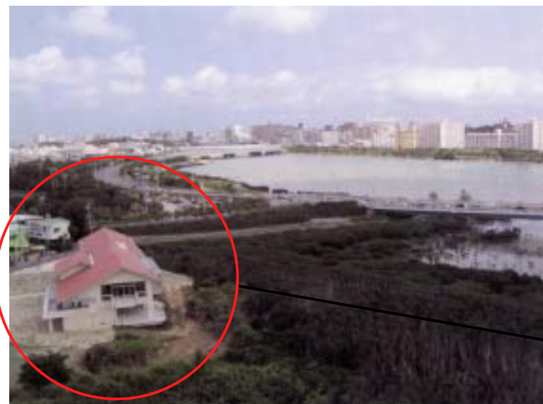
■ 漫湖水鳥・湿地センター