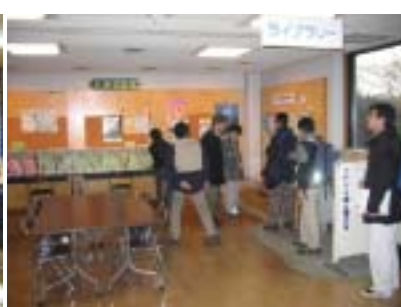
図2 野鳥園先進地視察結果 (都立東京港野鳥公園)