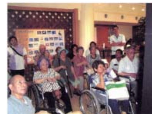
■ 干潟や野鳥の映像を楽しむお年寄り