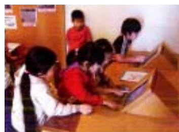
■ 検索タッチパネル