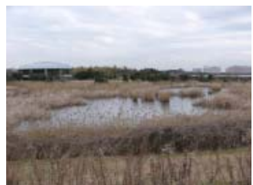
■湖面のカモ(ヨシが繁茂)