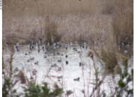
■ヨシ原はバン等のねぐら・営巣場