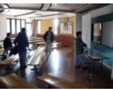
■レクチャールーム