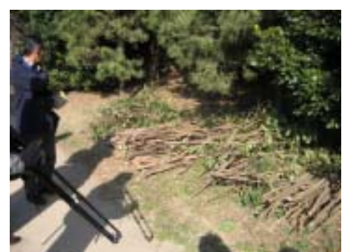
■伐採樹木は園内で処理