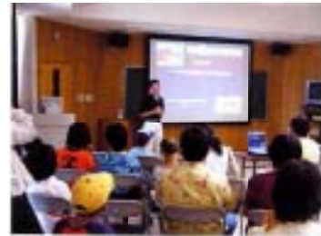
■ レクチャールーム