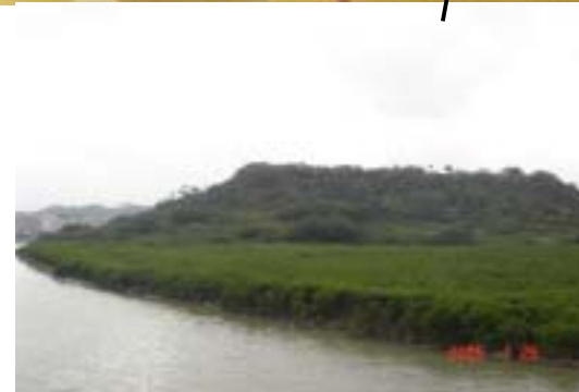
■ とよみ大橋南側に広がるマングローブ