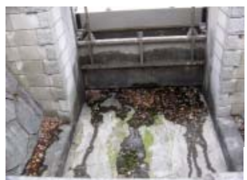
■水量が乏しく水門は閉じている