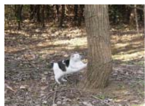
■園内に住みついた捨猫