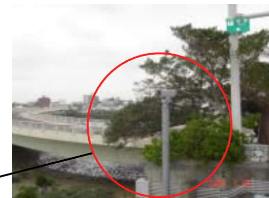
■ 遠隔操作の超望遠ビデオカメラ (66倍)