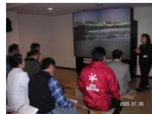
■ 100インチの大型画面で実物大の水鳥を生中継でセンター内で観察