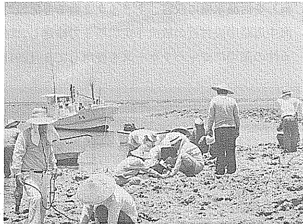
埋め込み法によるヒメジャコの種苗放流状況 （瀬長島地先大瀬）