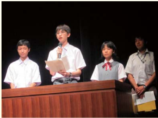
提案事業の発表(興南中学校3年生)

このように、産業振興策と雇用対策が連動し、さらに県民が一丸となって沖縄県の雇用情勢の全国並み改善に向けて取り組む県民運動が、「みんなグッジョブ運動」です。