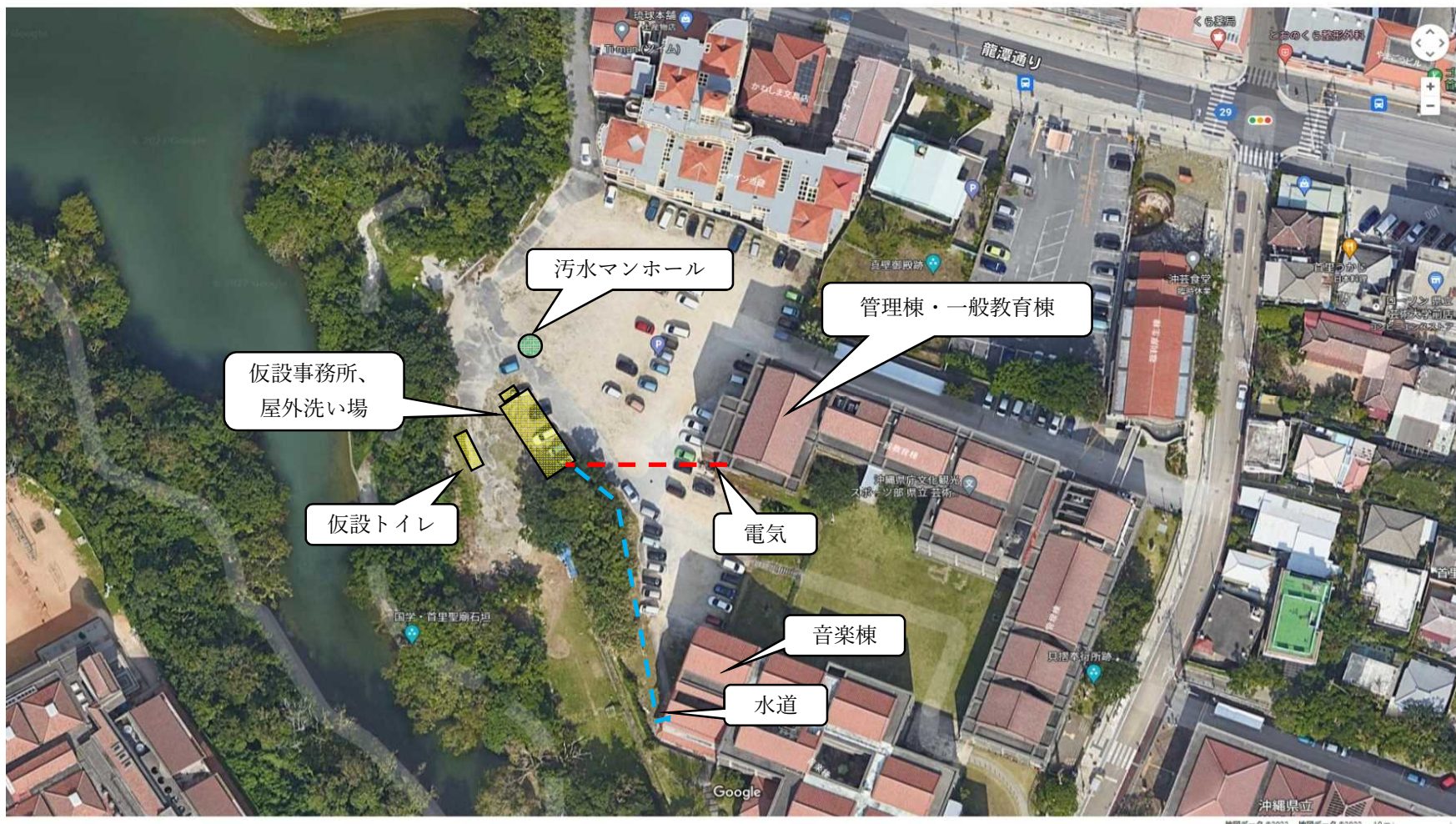
令和6年度 首里城公園発掘調査 仮設事務所置場所