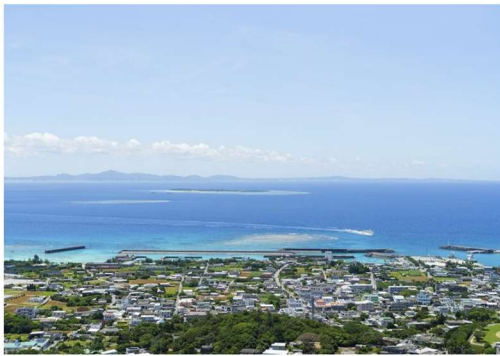
*伊江島のシンボル、城山からの景色

沖縄県は2023年度、たくさんの「お宝=魅力」をもつ離島各所の事業者さんたちが、SNSなどの『デジタルツール』を利用してさらに魅力的な発信をしていけるように「沖縄県主催📍価値を伝えて売りまくるためのデジタル講座」という取り組みを行っています。この記事は、参加された事業者さんを対象に、「ローカリティ！」のレポーターがその輝く魅力取材し執筆したものです。沖縄離島の魅力をご堪能ください。