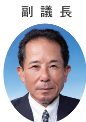
副議長 照屋 守之