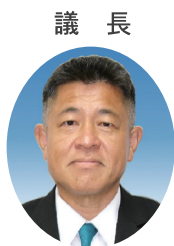
議長 赤嶺 昇